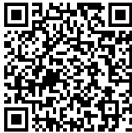
Les cours 2024-2025 Réviser / S'entraîner