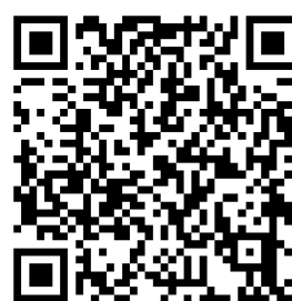
ENT technologie 3°1