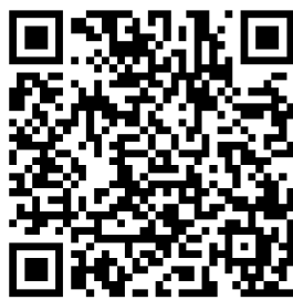
Les cours 2024-2025 Réviser / S'entraîner