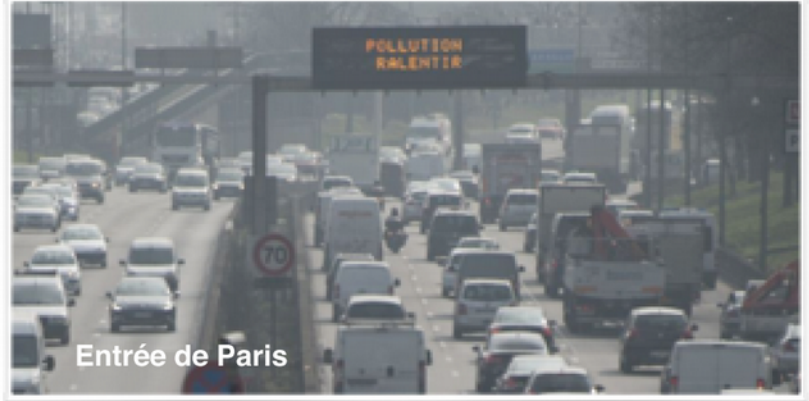
Entrée de Paris

Comment résoudre le problème apparent sur les illustrations ci-contre?